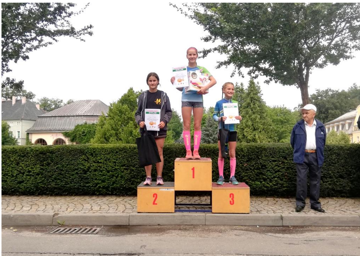
Na podium najszybsze dziewczęta w biegu na 400 m.