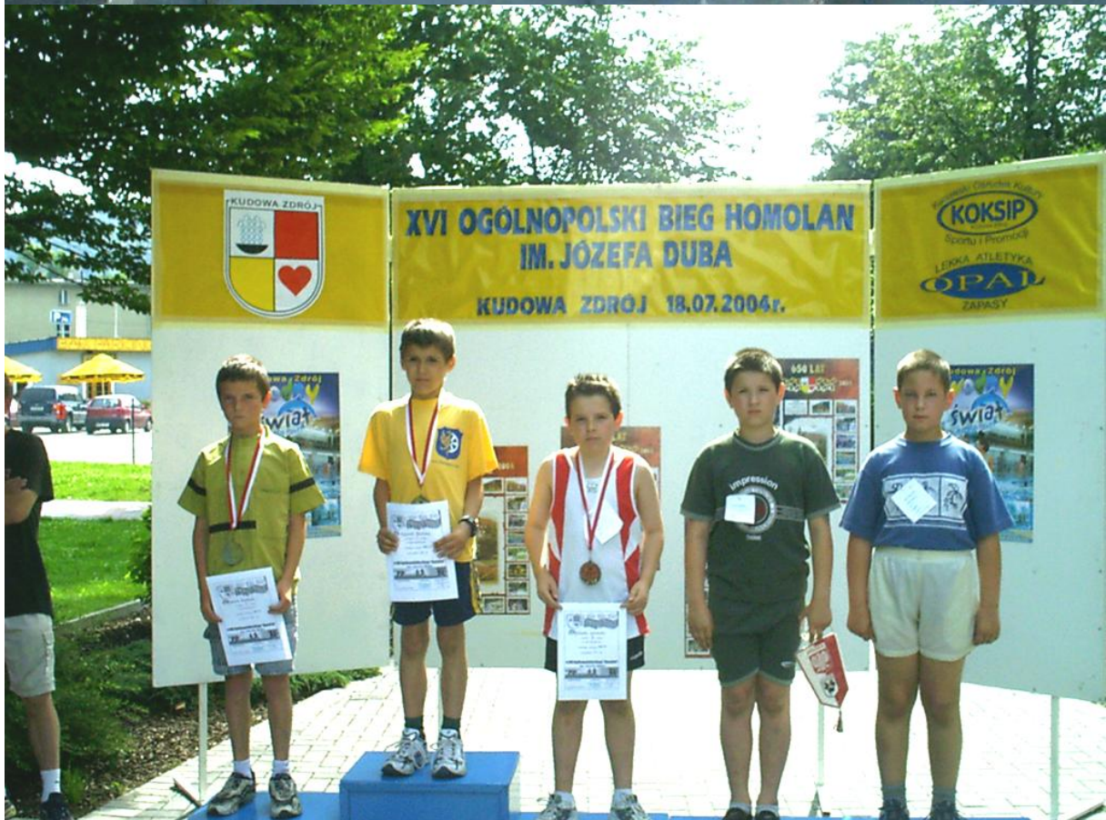
Dekoracja biegaczy ze szkół podstawowych.