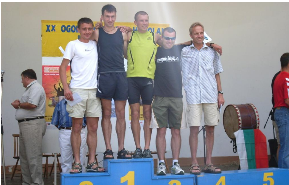
15 km – najszybsi biegacze (Top 5).