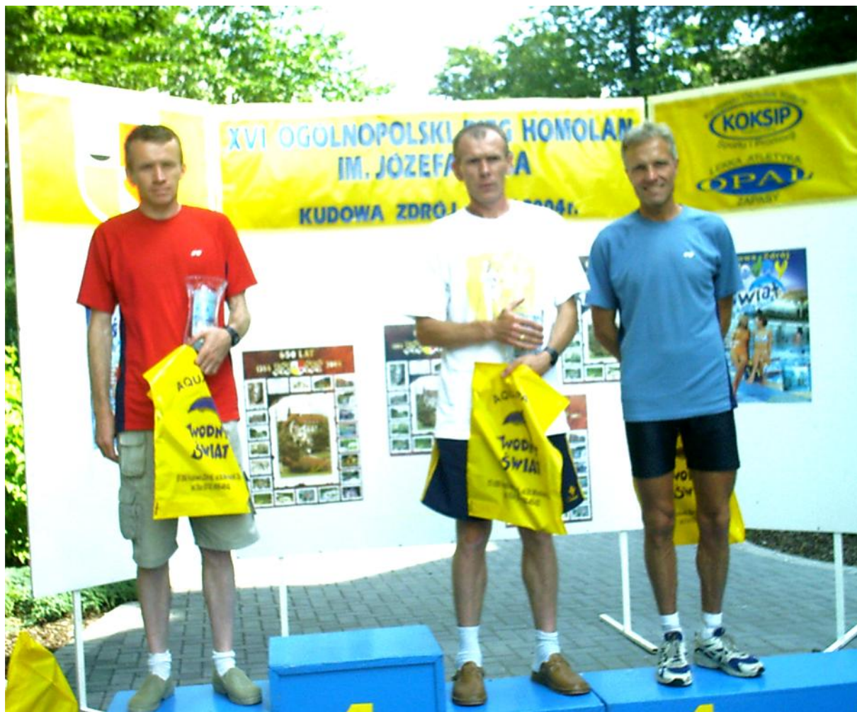
Dekoracja kategorii M40...