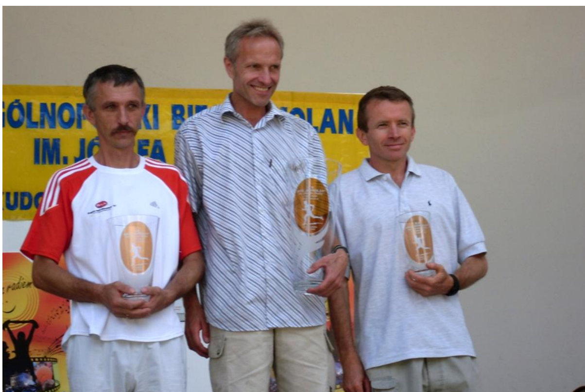
Medaliści kategorii M40.