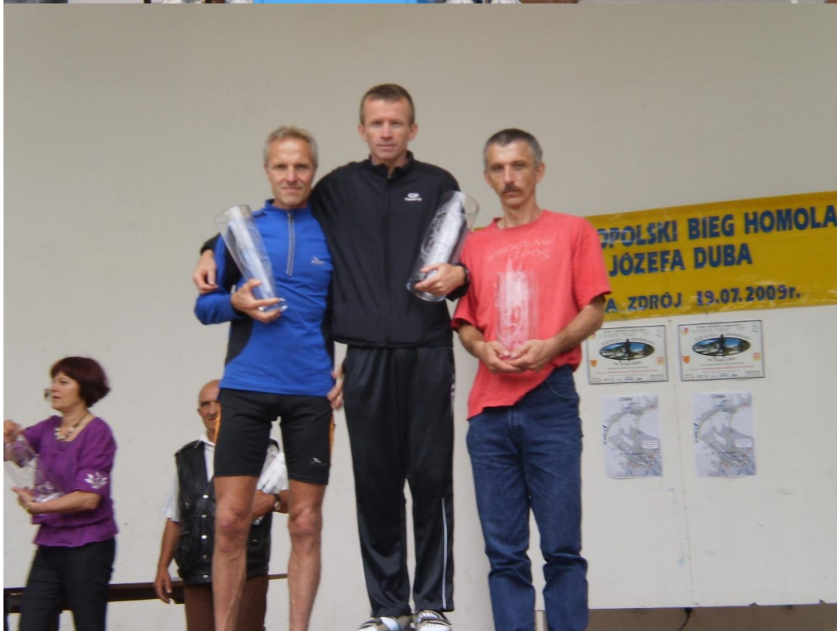
Na podium najszybsi biegacze kategorii M40.