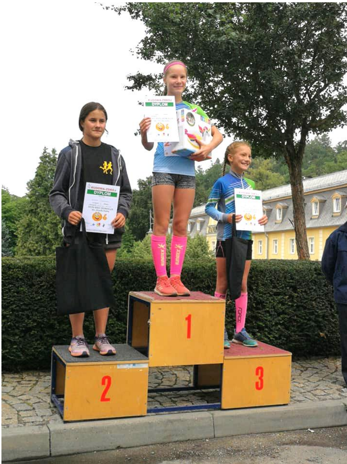
Top 3 – bieg na 400 m dziewcząt.