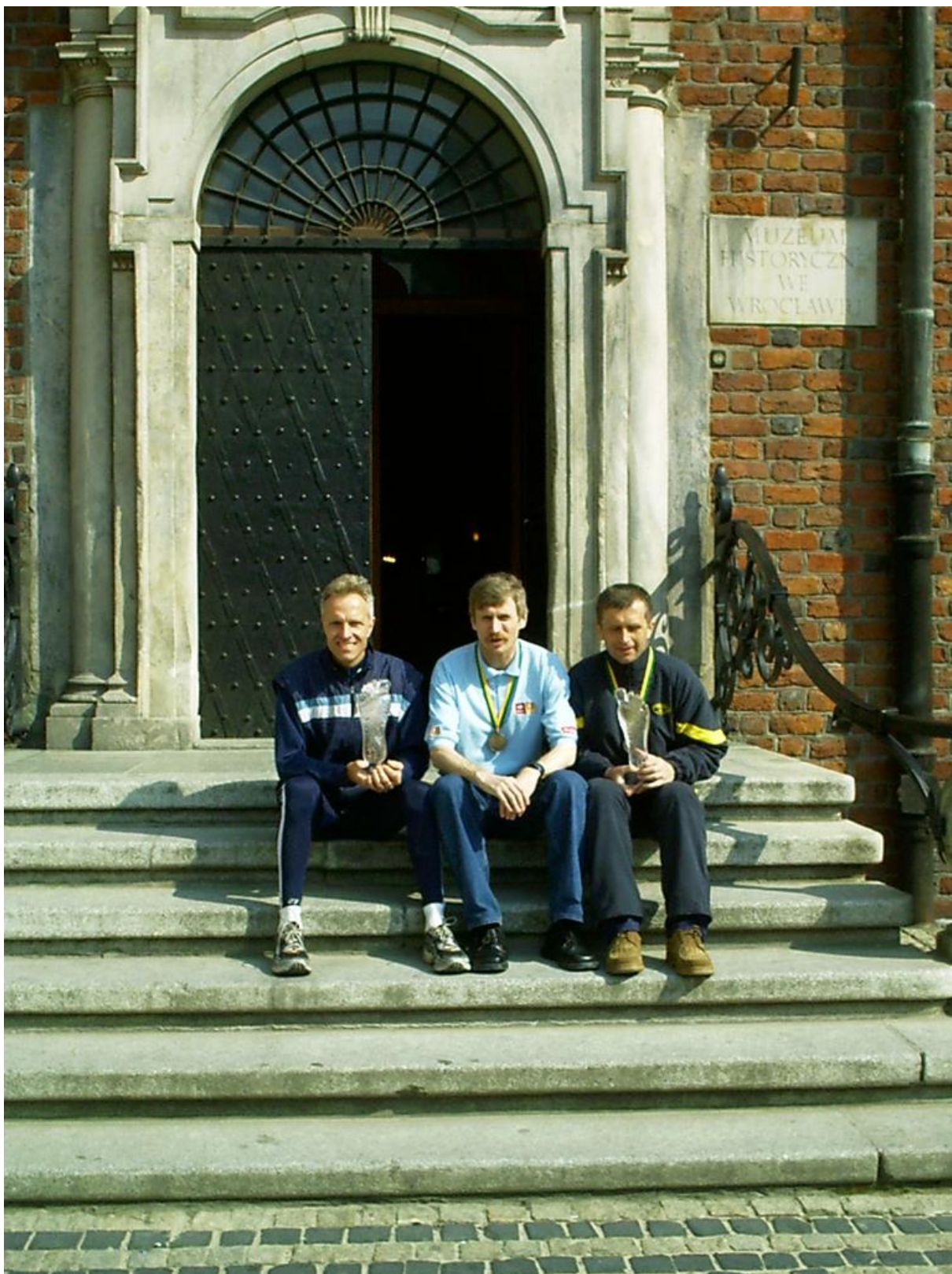
Drużyna OKB ITAKA Opole ...