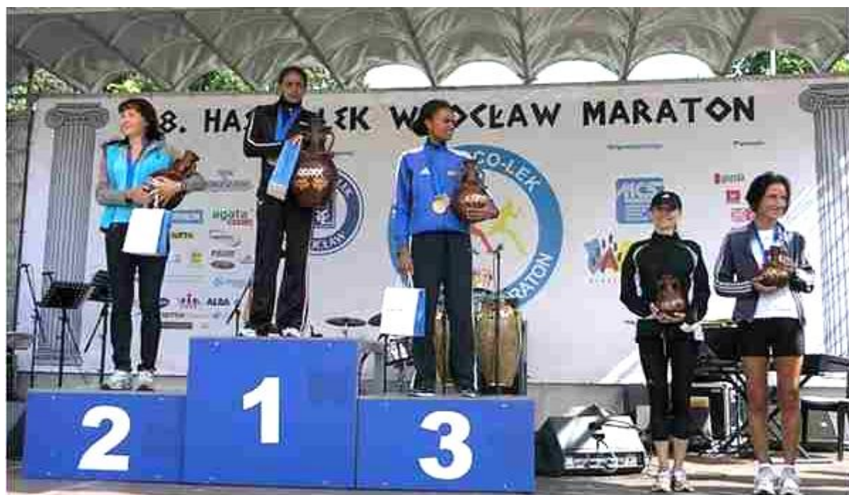
Dekoracja najlepszych maratonek 28. HASCO – LEK Wrocław Maraton ...