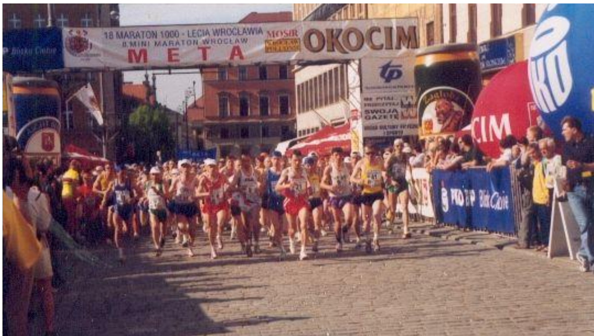
Start 18. Maratonu 1000-lecia Wrocławia.

18. Maraton 1000-lecia Wrocławia odbył się 29 kwietnia 2000 r. we Wrocławiu. Bieg ukończyło 468 osób (z tego 4 osoby zostały zdyskwalifikowane).