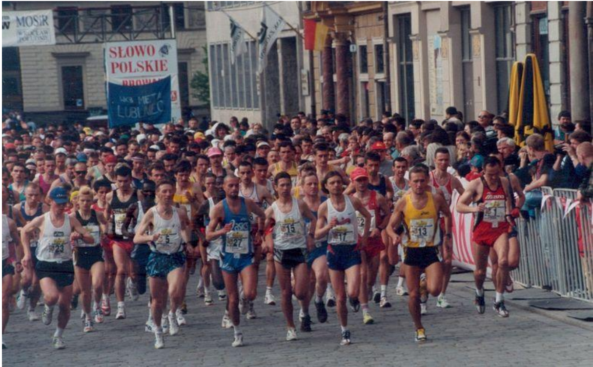
Start 16. Maratonu Wrocław.

16. Maraton Wrocław (68. Mistrzostwa Polski w Maratonie) odbył się 26 kwietnia 1998 r. we Wrocławiu. Bieg ukończyło 537 osób.