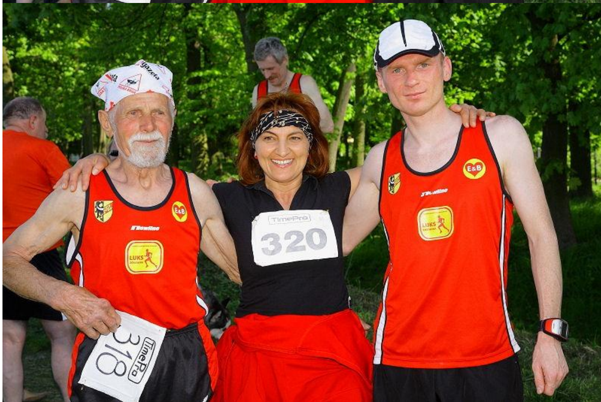
Już po biegu ...