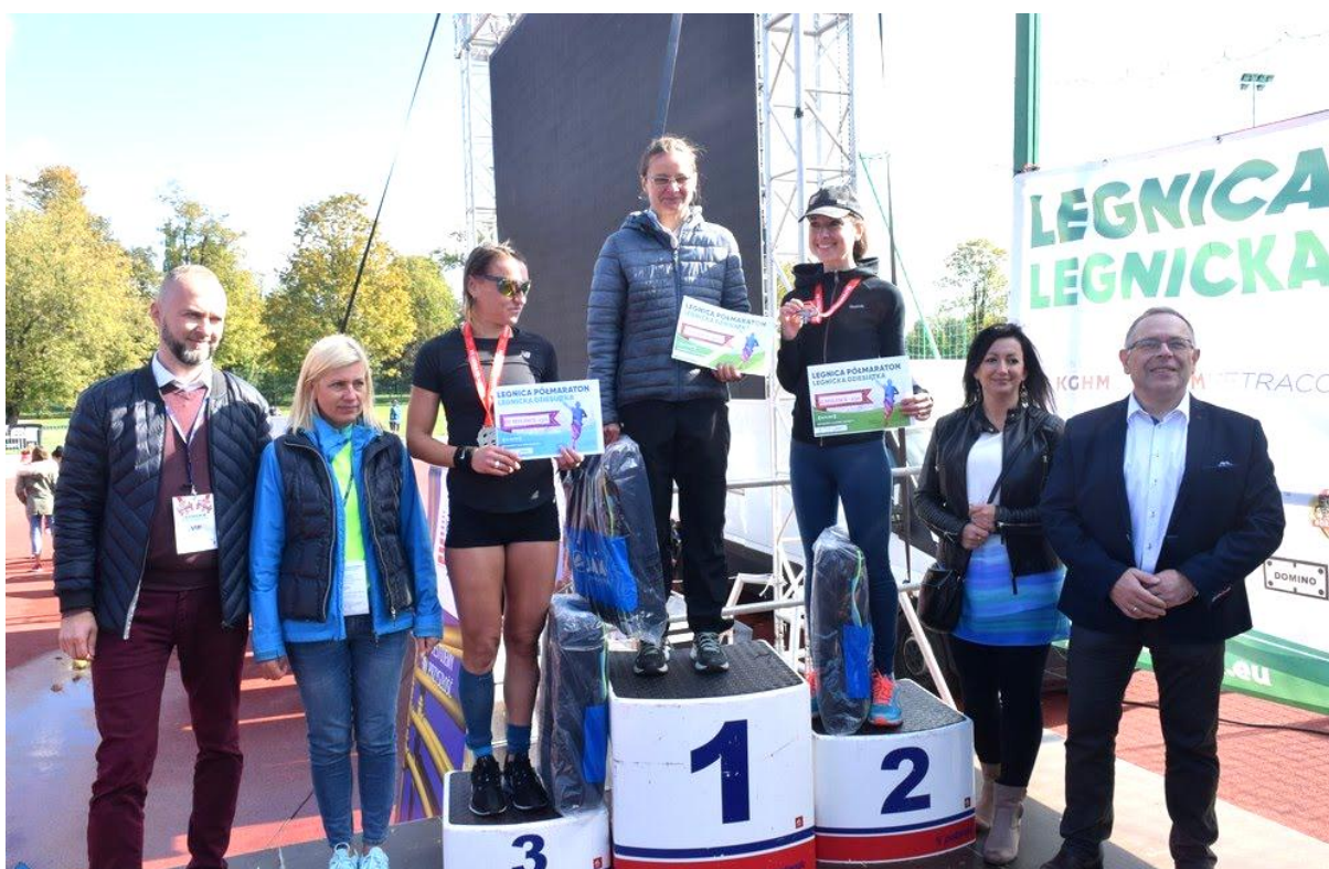
VIII Legnica Półmaraton – na podium najszybsze panie.