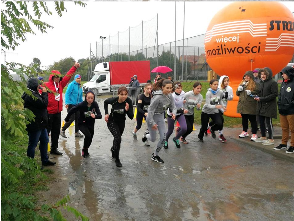
800 m dziewcząt – start.