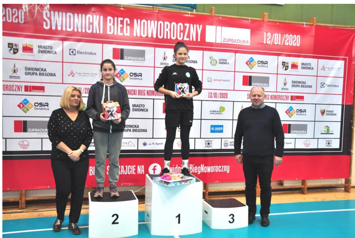
Dekoracja najszybszych dziewcząt w biegu na 2 km.