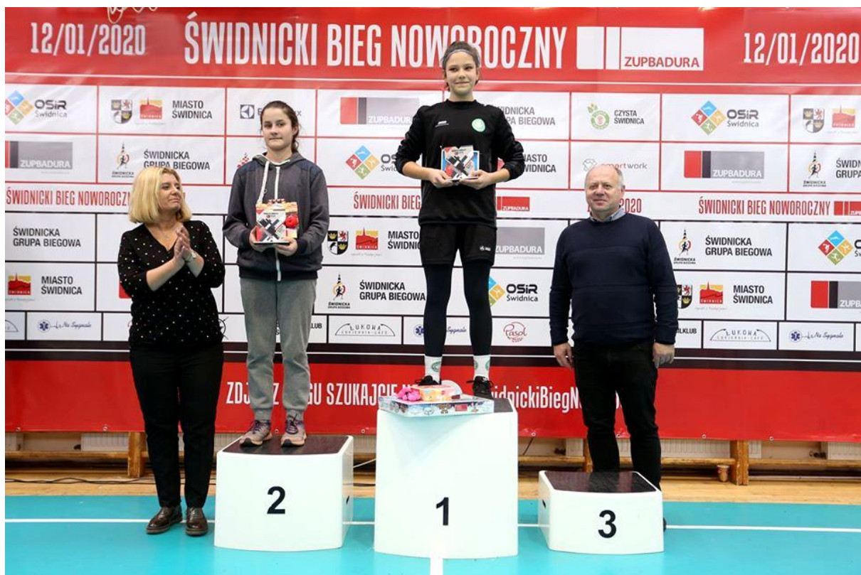
Top 2 dziewcząt w biegu na 2 km.