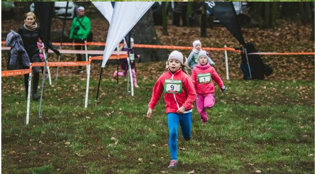
Na trasie dziewczęta kategorii wiekowej D1.