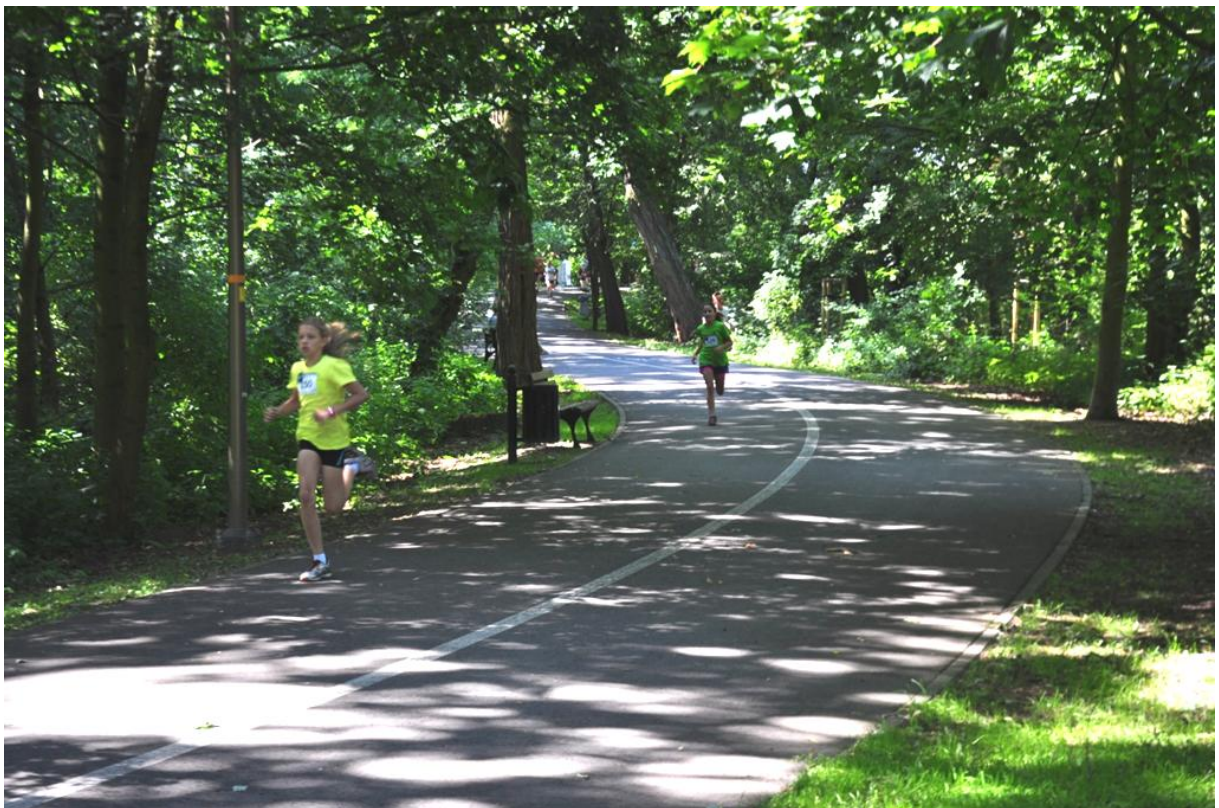
Dagmara biegnie druga.