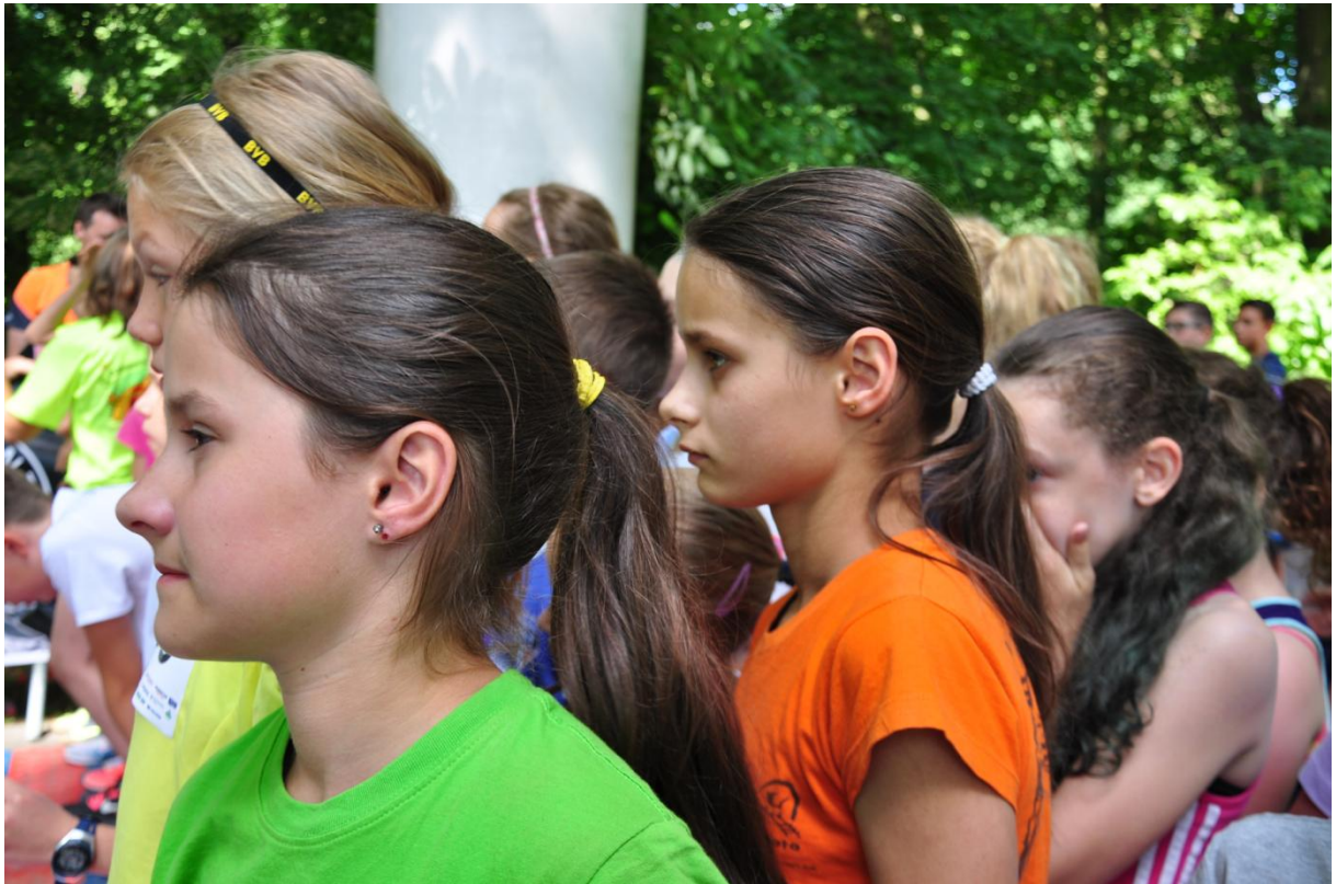
Przed startem do biegu kategorii 2007-2006 dziewcząt na dystansie 800 m.