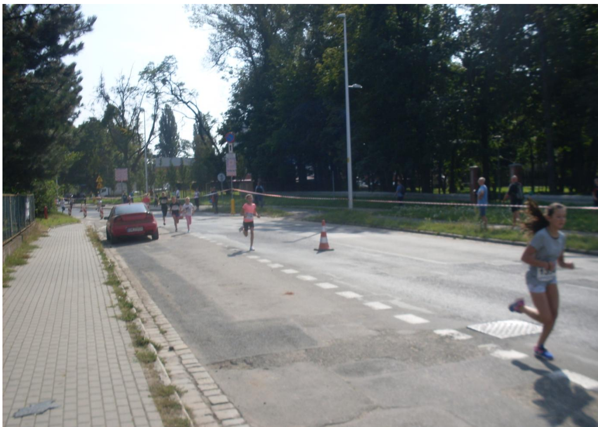
Czołówka biegu dziewcząt rocznika 2006 na około 300 m przed metą, Dagmara biegnie czwarta (w czarnej koszulce, obok samochodu).