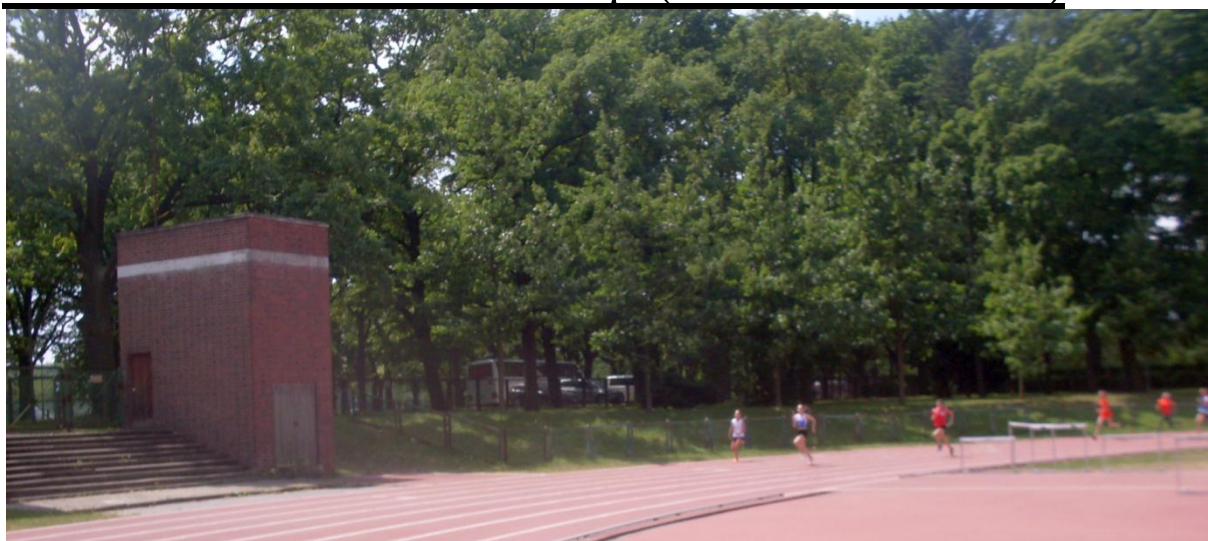
Sztafeta szwedzka dziewcząt – 2 zmiana po pokonaniu 150 m (Daria w białej koszulce, na ósmym torze).