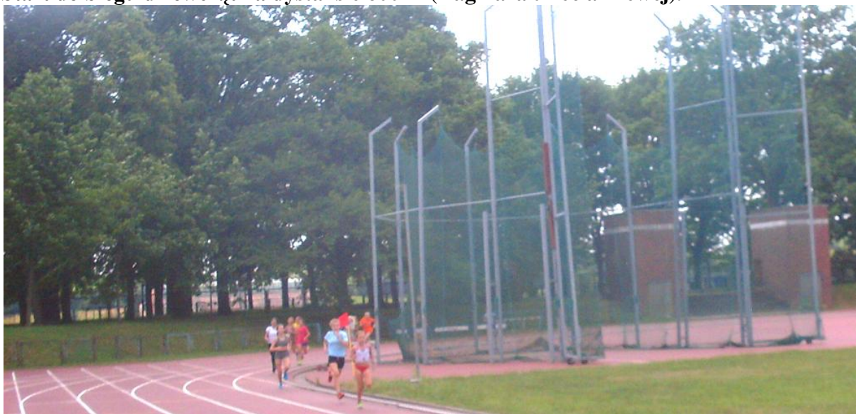
600 m dziewcząt – czołówka pokonała już 300 m, Dagmara biegnie piąta.