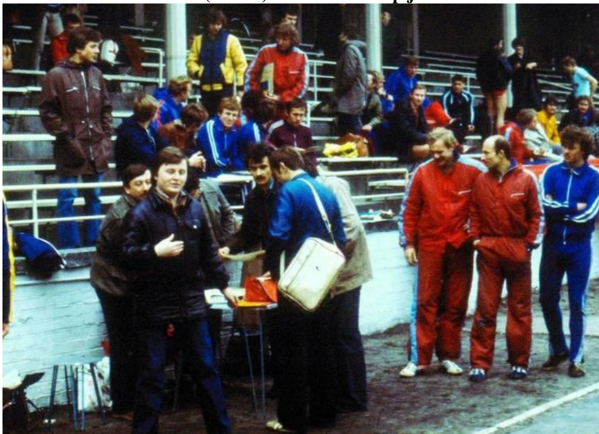
Przed rozpoczęciem VI Otwartych Mistrzostw Politechniki Wrocławskiej w Lekkiej Atletyce (28.04.1979).