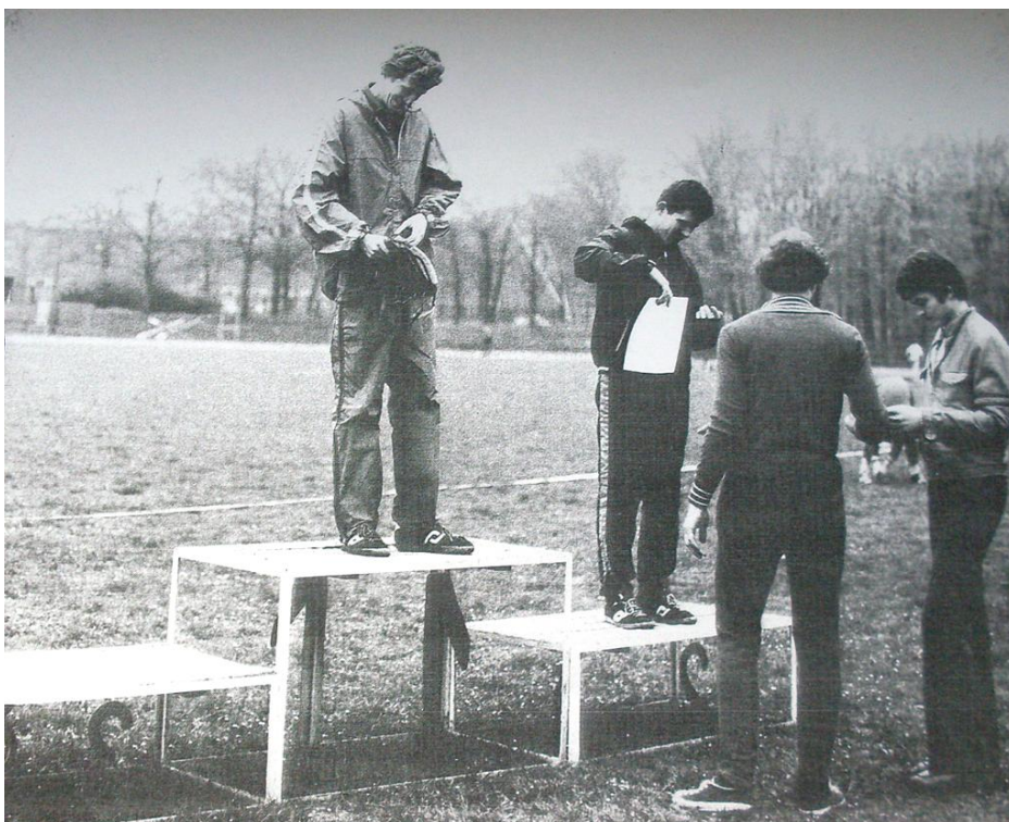
1 500 m mężczyzn – dekoracja.